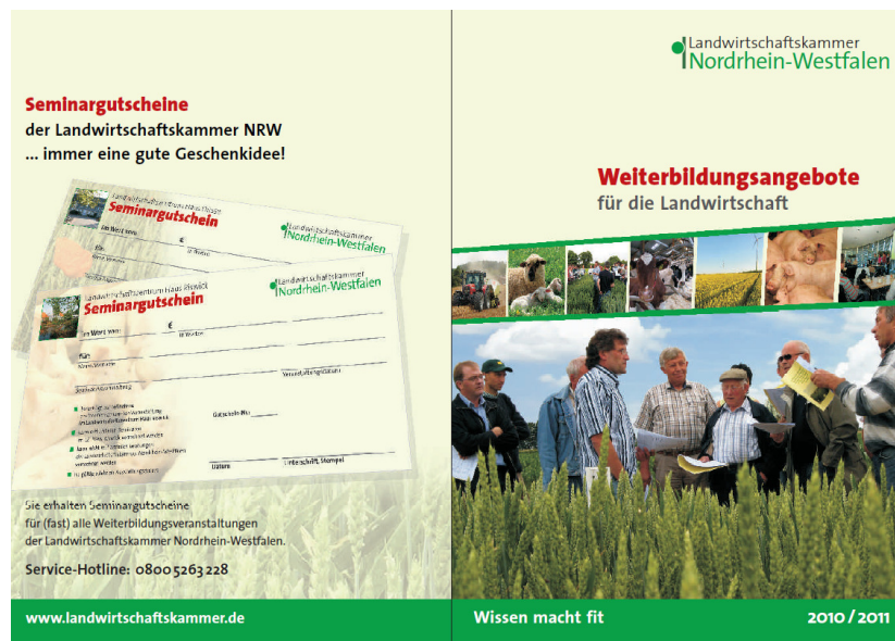
Abb. II / 2: Zentraler Weiterbildungskatalog der LK NRW 2010/2011

Ende September wurde der zentrale Weiterbildungskalender für die Landwirtschaft an ca. 7000 Landwirte in NRW versandt und parallel im Internet veröffentlicht. Mit diesem Angebot ist es jetzt möglich, sich zentral per Fax oder online zu den Seminaren der Landwirtschaftskammer anzumelden.