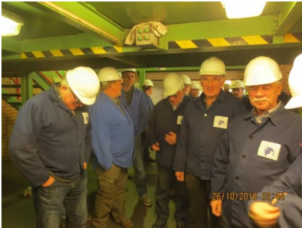
Warten auf die Grubenfahrt.