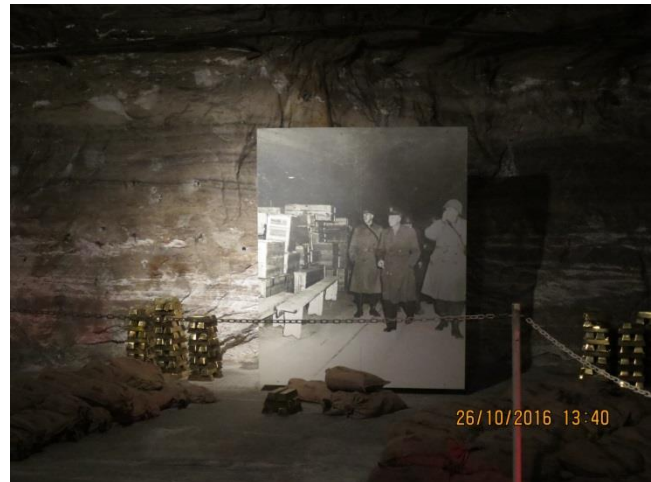
General Eisenhower besichtigt den Fund.

Nachdem uns anschließend eine Simulation einer Sprengung im Bergwerk gezeigt wurde, ging es weiter zur Kristallgrotte. In 800 m Teufe befindet sich ein Schatz der Natur, die weltweit einmalige Kristallgrotte. Sie wurde erst 1980 entdeckt und von der Akademie der Geowissenschaften zu Hannover e.V. im Jahr 2006 als Nationales Geotop ausgezeichnet. Die Entstehung ist den erdgeschichtlichen Vorgängen des Tertiär zuzuordnen und steht in unmittelbarem Zusammenhang mit dem Rhönvulkanismus.