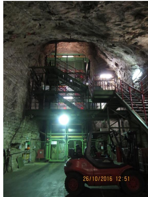
Der Seilzug auf der 2. Sohle.

Unter Tage angekommen, standen allradgetriebene Fahrzeuge bereit. Nach ersten Informationen durch unsere Gruppenführer hieß es verteilt auf zwei Fahrzeuge: "Aufsitzen"! Daraufhin konnte die erlebnisreiche Tour durch ein unendlich erscheinendes Labyrinth von Strecken und Abbaukammern beginnen.