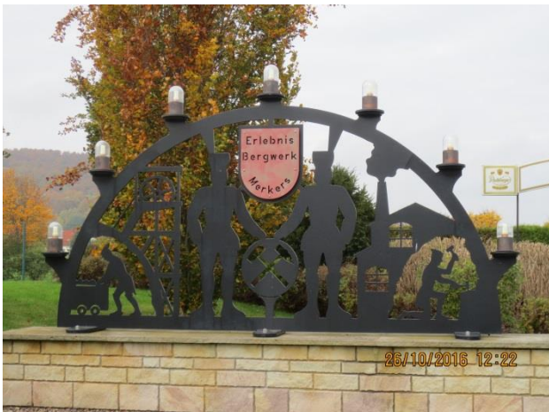
Am Eingang der Erlebnisbergwerkes.

Nach dem gemeinsamen Mittagessen ging es weiter zum knapp 10 km entfernten Erlebnisbergwerk in Kieselbach.