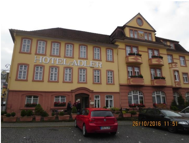
Hotel Adler in Vacha.