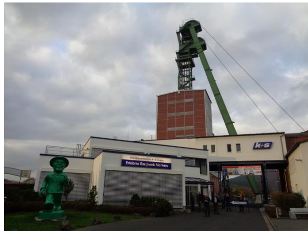
Besucherzentrum des Erlebnisbergwerkes.

Dort angekommen wurden wir alle mit Jacken und Helmen ausgestattet, bevor wir per Seilzug (im Förderkorb) begleitet von zwei Bergleuten in nur 90 Sekunden bis auf die 2. Sohle, in eine Teufe von über 500 Metern, hinabgefahren sind.