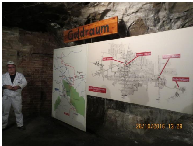
Ein Labyrinth aus mehreren tausend Kilometern Wegen und Kammern.

Eine weitere Station unter Tage ist der historische Goldraum. Hier wurden zum Ende des zweiten Weltkrieges die Gold- und Devisenbestände der Deutschen Reichsbank, sowie in weiteren Kammern umfangreiche Bestände Berliner Museen eingelagert. Interessante Requisiten, Bilder und Filmberichte aus der damaligen Zeit und die Erläuterungen der Bergwerksführer versetzen uns in diese Zeit zurück. Es fällt nicht schwer, sich vorzustellen, welche unschätzbaren Werte hier gelagert waren. Die Grube Merkers geriet für einige Wochen in den Blickpunkt der Weltöffentlichkeit, denn das Auffinden dieses Schatzes durch die Amerikaner und die Grubenfahrt von General Eisenhower machten im April 1945 weltweit Schlagzeilen. (Quelle: www.erlebnisbergwerk.de , Abruf am 08.11.2016)